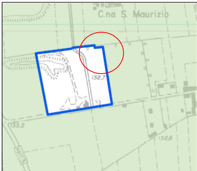
STRALCIO PERIMETRO PLIS